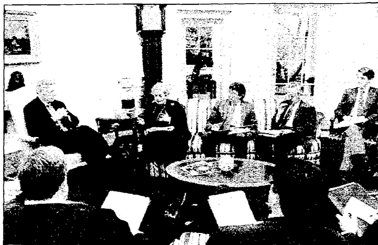
الرئيس الأمريكي بيل كلينتون يتشاور مع وزيرة الخارجية ومستشاريه لشؤون الشرق الاوسط حول أزمة المفاوضات